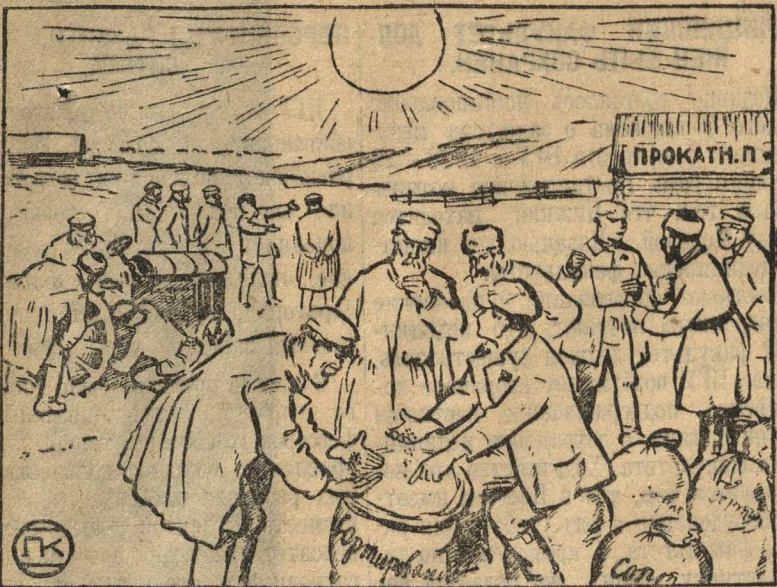
Задача комсомола вести агитацию за коллективные посевы, за улучшение сорта семян, за расширение ярового клина.