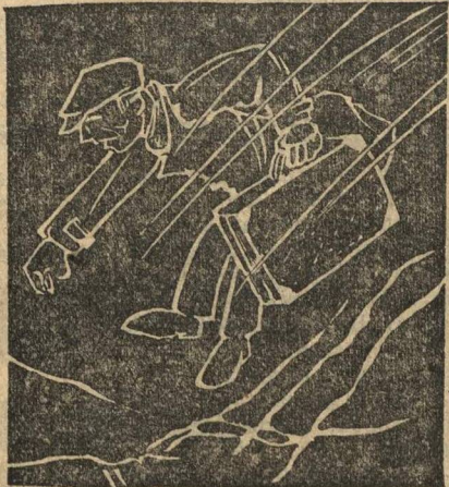
Эйтель последовал общему примеру...

несся на север грохочущий вихрь. Размеры его было трудно определить: окружавшие его тучи дыма, пыли и пара, пронизанные изнутри слепительным светом, сливались в пламенное облако. Вдруг ахнул олушавший взрыв, и оба собеседника приникли ко дну канавы. Это огненное облако приблизилось к паровозу и мгновенно обратившись в пар вода разнесла котел. Над их головами просвистело несколько обломков. Когда оба, задыхаясь от жара, снова выглянули из канавы, вихрь уносился уже дальше к реке. Еще минута—и целые вихри пара из вскипевшей воды окутали его плотной атмосферой. Горя-