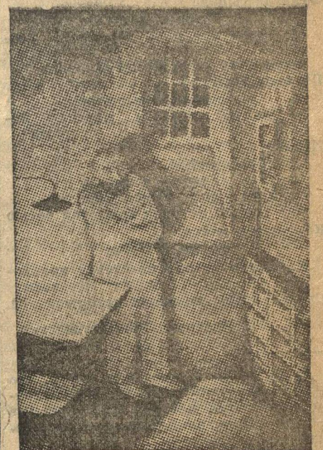
Заклученные в одиночке капиталистической тюрьмы. Тысячи революционеров так же брошены в тюрьмы.