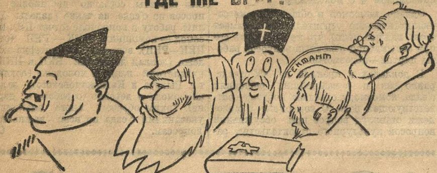
ТИТ ТИТЫЧ—ДЕРЕВЕНСКИЙ КУЛАК.

Поднаживши жирку, деревенский кулак пытается показать ногти. Это мы видели на примере хлебозаготовок, когда кулак прятал хлеб, вздувал цены и т. п. Это мы видим в каждую кампанию пере выборов советов, кооперации, КРОВ и т. п.