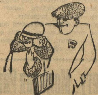
Не водится с комсомолками и работницами, а бежит за нашманкой...

Все это то, что является характерным для нашмана и помещика. Мещанин никогда не признавал женщину за человека. А, к нашему стыду, в комсомоле еще много таких комсомольцев, которые не отрешились от этого. Есть, наконец, и такие случаи, когда комсомолец или молодой рабочий не водится с комсомолками и работницами, а бежит за нашманкой, потому что она с пышным одет, пропахла духами и косметикой.