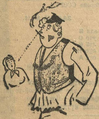
Жениться на батрачке для «порядочного человека»—позор...

Вот факты: во многих, если не в большинстве, селах нашей губернии распространено мнение, что пастух и жене—последние люди в селе, что жениться на батрачке для «порядочного человека»—позор, что выйти замуж за батрака—срам.