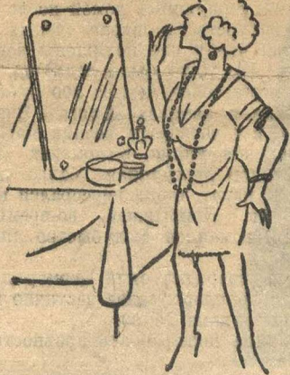
По целым часам стоят у зеркала.

Некоторые другие комсомольцы и комсомолки, благодаря своему внешнему виду (одежде, краске и т. п.) завязывают связи с нашманской молодежью, возвращаются в их среде.