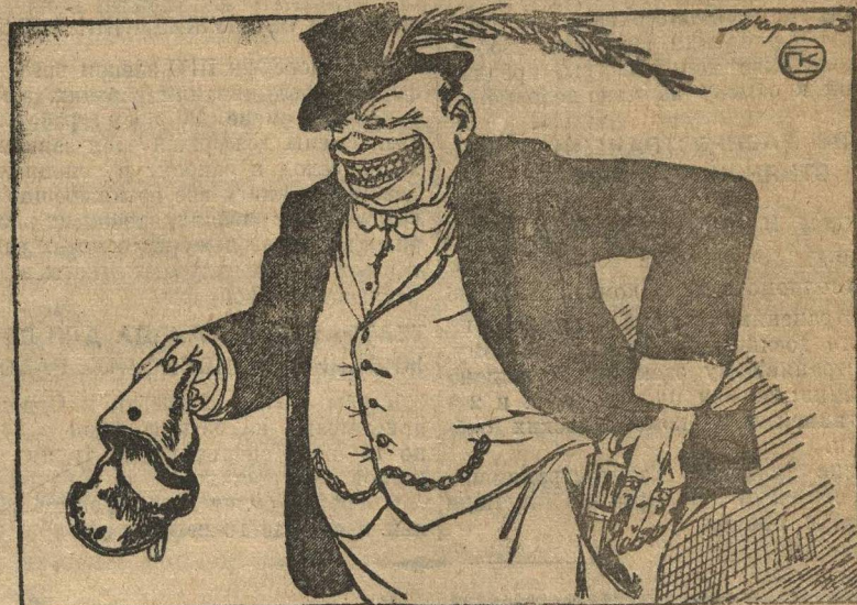
— РАЗОРУЖАТЬСЯ? С НАШИМ УДОВОЛЬСТВИЕМ! ПОЛУЧИТЕ КОБУРУ.

Представитель Англии на конференции по разоружению заявил, что Англия разоружена до последней степени.