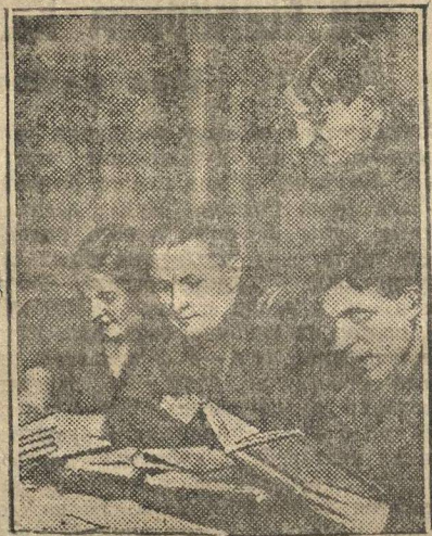
Вечерние общеобразовательные курсы, организованные на прядильно-ткацкой фабрике «Советская Звезда» в Ленинграде.