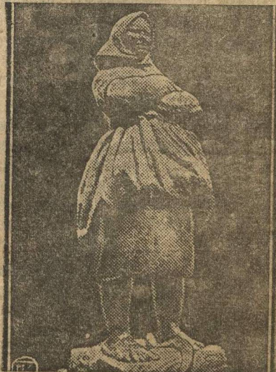
«Крестьянка»—работа женщины-скульптора Мухиной, которой присуждена 1-я премия (1000 руб.).