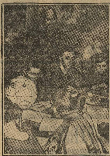
На вечерних общеобразовательных курсах. Урок географии.