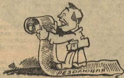
А ВЫШЕЛ БОЛТУН...

Смешно, когда удар встречает пустоту и не только смешно. «Все это было бы смешно, если-б не было так грустно». И очень даже грустно. А такие уда-