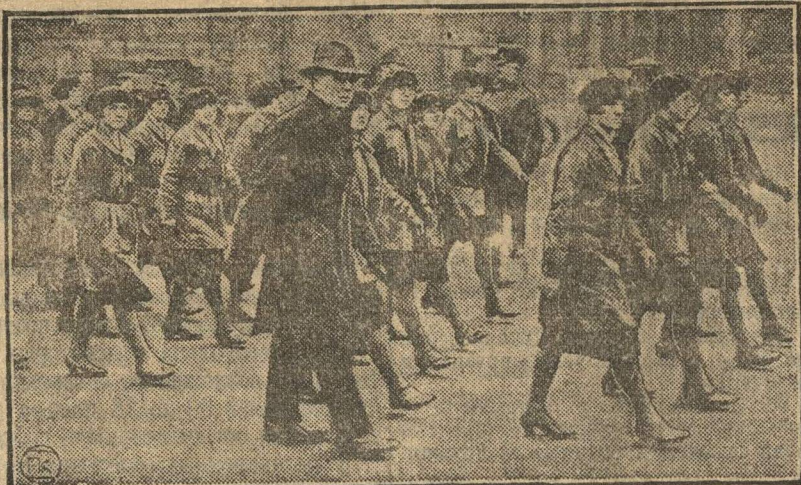
31 марта в Лондоне в шпалерном сквере состоялась грандиозная демонстрация протеста английских рабочих и против дальнейшего снижения заработной платы, что особенно отражается на женщинах в угольных районах. Многие из демонстранток были одеты в новую форму. На снимке — демонстрантки в форме.

Глава II говорит о принципах сокращения морских вооружений. Государства делятся на 2 категории. Предусматривается немедленный вывод из строя авио-носцев, разоружение и при-ности от численного состава их воздушные суда, исключение стил, на три группы государств.