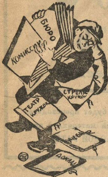
ТРУДНО ОБ'ЯТЬ НЕОБ'ЯТНОЕ...

Петрова—в редколлегиях и т. д. Если же Иванов пытается отказаться от вовлечения в кооперацию (так как его больше интересует работа со стенгазетой), ему отвечают: «Нам лучше знать». И вообще, дескать, по уставу ты не имеешь права отлынивать от союзной работы.