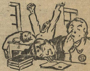
ОНИ СКУЧНЫ, СУХИ...