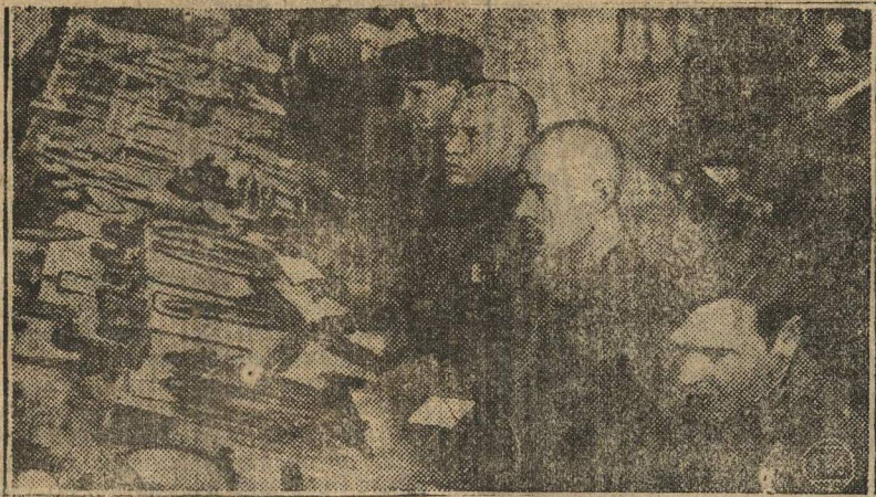
Первое всесоюзное производственное совещание текстилей, созданное 14 марта в Иваново-Вознесенске. Это первый опыт в практике советских профсоюзом. Делегаты во время перерыва осматривают выставку «качества продукции», открытую при конференции.