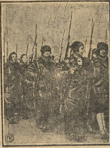
КОМСОМЛКИ — СТРЕЛКИ.