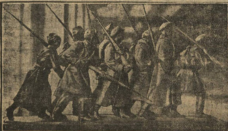
Проект памятника «Защитникам Петрограда от Юденича», (гипс) — скульптора Мажисера.

вета выступил член президиума центрального совета, тов. Олешук.