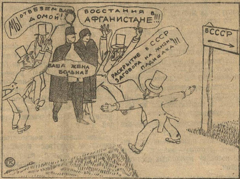
Английские газеты всячески стараются отговорить падишаха Афганистана от поездки в СССР.