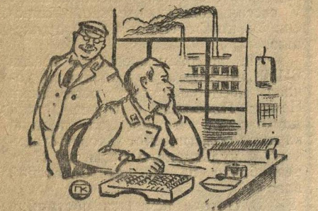
Молодые специалисты зачастую используются не на производстве, а в конторах.

Греха таить нечего и вопрос надо ставить с правдивой прямотой: молодому специалисту, специалисту красному, социалистическому пролетарской обществу мало внимания. Партия в свое время провела энергичную борьбу против спедедства. Партия внедрила в жизненный обиход ленинскую мысль о том, что социализм нельзя построить только силами коммунистов. Специалистам создана благоприятная обстановка в работе, им даны некоторые бытовые спец-привилегии—только ра-