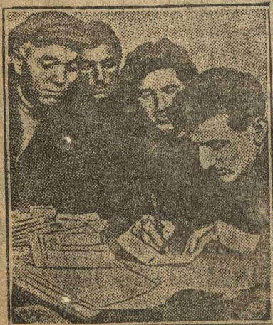
Прием в партию в тифлиской организации.