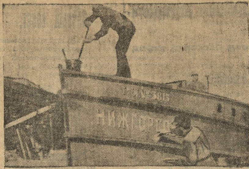
РЕМОНТ СУДОВ В ЗАТОНЕ «СТРЕЛКА».