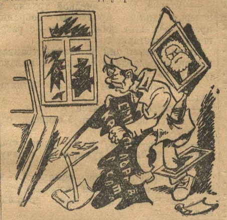
Партийная и комсомольская ячейки на это не обратили внимания. Овод.

Пионеры возмущены такой изобретательностью заводууправления.