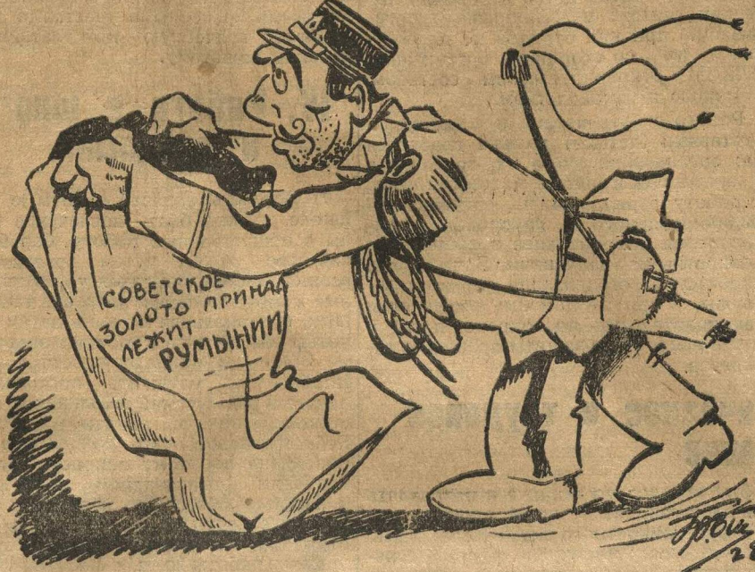
ЕЩЕ ОДИН, С «ПИСАНОЙ ТОРБОЙ» ЗА СОВЕТСКИМ ЗОЛОТОМ.

Вслед за Францией Румынское правительство обратилось к правительству Соединенных Штатов с просьбой задержать прибывший в Америку транспорт советского золота, в качестве залога за конфискованное в Москве золото румынского госбанка.