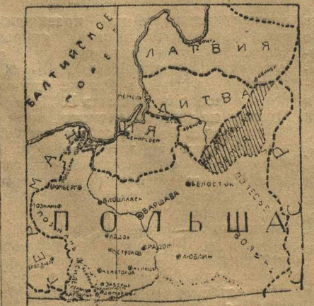
ПОЛЬША И ЛИТВА. (Заштрихована Виленская область).

ва протестовала против этого, но Польша не обращала внимания на протесты. На конференции Литва снова подняла вопрос о возврате ей Виленщины. Польская делегация не согласилась вернуть—она не хочет даже об этом разговаривать.