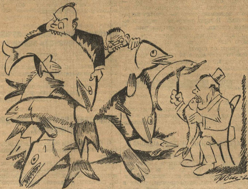
«РАЗРЕШЕНИЕ ВОПРОСА» ГОСУДАРСТВЕННОЙ ВАЖНОСТИ.