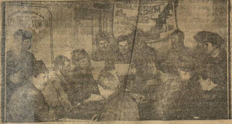
ПЛЕНУМ КОМИТЕТА КРЕСТЬЯНСКОЙ ВЗАИМОПОМОЩИ ОБСУЖДАЕТ ВОПРОСЫ ПОСЕВНОЙ КАМПАНИИ.

Яровой сев — боевой участок комсомольской работы.