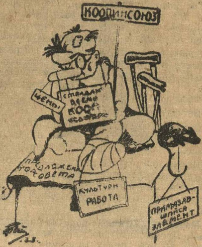
...или „кооперация инвалидов“

Кооперативно-торговая секция Горсовета, проверив работу Коопинсоюза, выяснила, что большая часть предложений, данных Горсоветом союзу, еще в прошлом году, не выполнена.