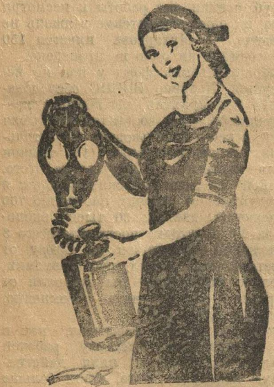
РАБОТНИЦА С ПРОТИВООГАЗОМ.

На третьем месте — расходы на социально-культурные нужды — народное образование и т. д. Мы имеем крепко увязанную цепь, каждая расходная графа вытекает из другой.