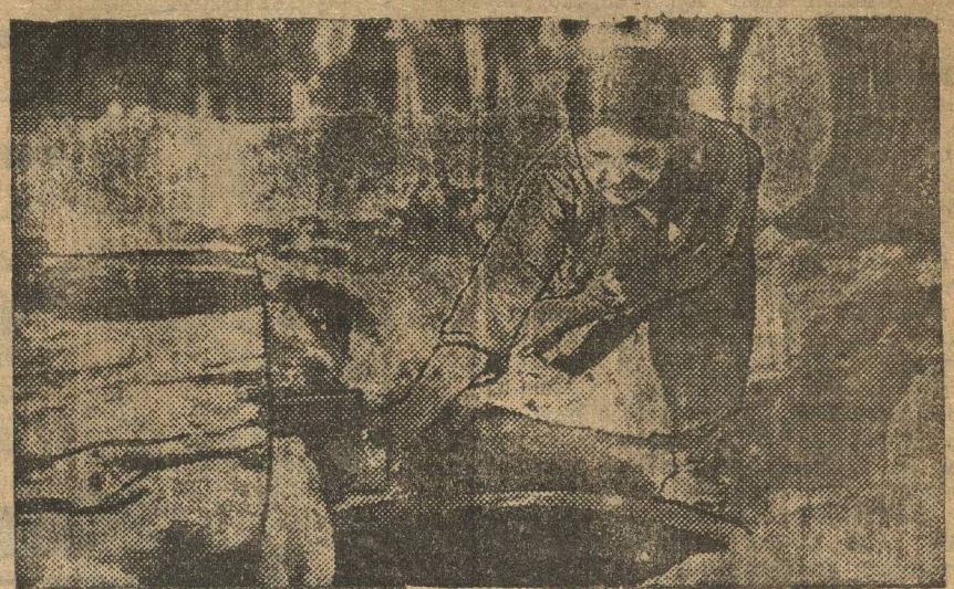
Кустарный смолокурный завод. Работает на нем всего одна работница. Продукция завода около полутора тысячи пудов в год.

На снимке работница набирает в стакан выработанный скипидар для пробы.