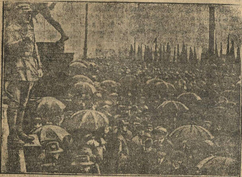
МИТИНГ КРАСНОГО СОЮЗА ФРОНТОВИКОВ В БЕРЛИНЕ.

Социал-демократия подготовила почву для требования о роспуске союза. Никакие запрещения — закончил Тельман — не смогут убить Красный союз фронтовиков. Выступивший с ответом министр внутренних дел Рейдель заявил, что Красный союз фронтовиков является революционной организацией. Как уже сообщалось, комиссия не приняла никакого постановления, вследствие чего решение вопроса переносится в Верховный государственный суд, который будет созван в ускоренном порядке.