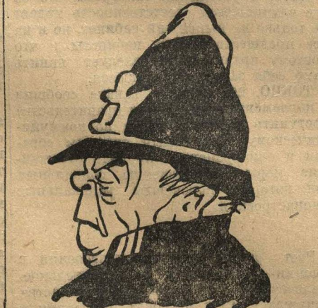
Джойнсон Хикс — заклятый враг СССР.

Нажим капиталистов на рабочий класс усилился. Буржуазия объединяется все теснее для борьбы с пролетариатом.