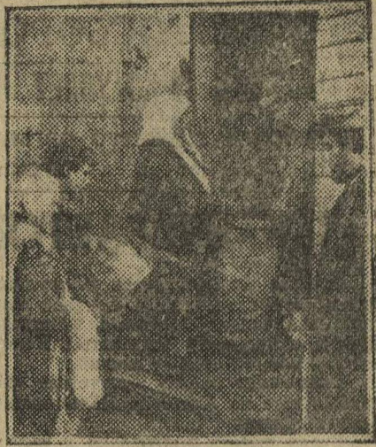
Бедняки и батраки получают семенную ссуду к весеннему севу.

В последние дни план коллективизации и подготовки к севу проработали: пленум райкома ВКП(б), пленум РКК'а, конференция бедноты и батрачества, районное собрание делегатов-колхозников, конференция колхозной молоде-