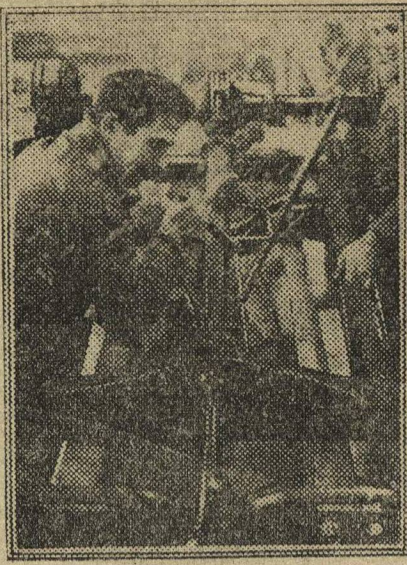
Сборка шасси автомобиля на неподвижном конвейере.

Тянул, ляпнул окружок и без всяких с'ездов выдвинул представителей на краевой с'езд и уже прислал в Н.Новгород. А с'езд в Н.Новгороде начнется только 10 февраля.