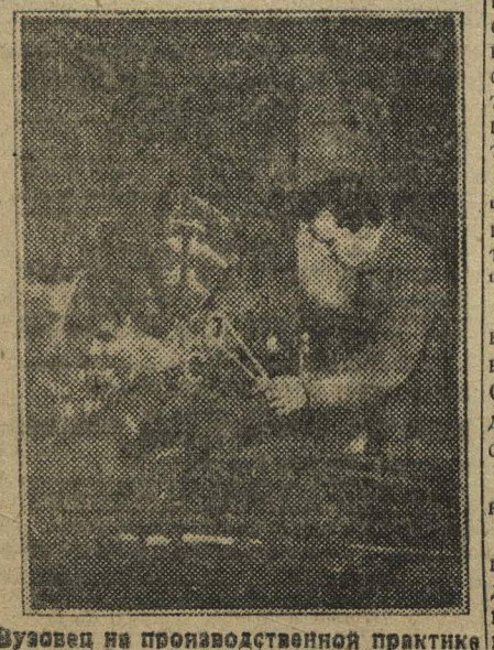
Возвед на производственной практике