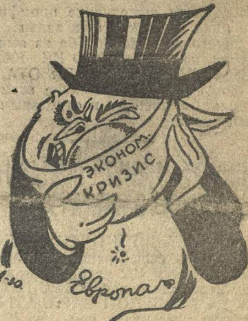
Злокачественная опухоль на капиталистическом лице.

Вслед за Америкой экономический кризис распространяется на большинство стран Европы.