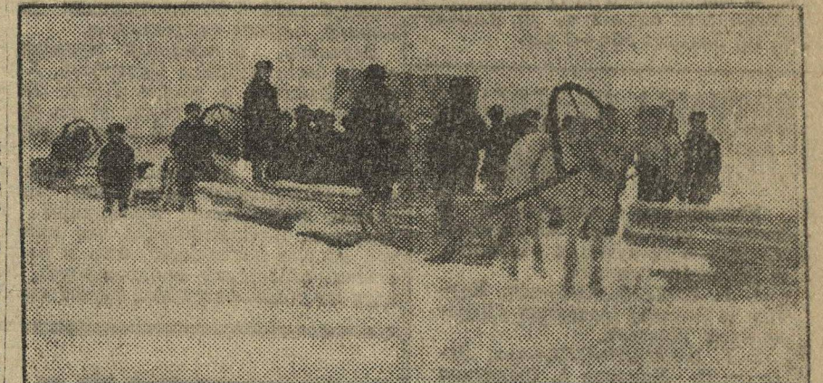
КРАСНЫЙ ЛЕСНОЙ ОБОЗ. (Шарьинский район, Котельническ. округа).

Партячейка и ячейка КСМ лесозавода треста Севостлеса, при разезде Теша (рядом с Учхозом) нисколько не заботится о лесорубах. Культработа среди лесорубов совершенно не ведет-