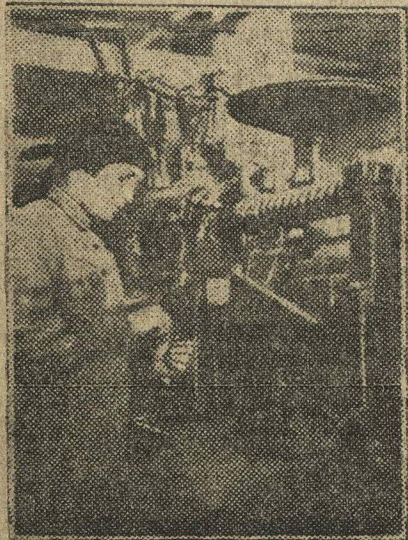
Ударница ленинского призыва

го сделать, нужно принимать меры. Те бюро, которые НЕ МОГУТ РУКОВОДИТЬ социалистическим соревнованием, НЕ ОРГАНИЗУЮТ всю работу, ячейки в соответствии с хозяйственными задачами предприятия, НУЖНО РАСПУСКАТЬ , привлекая к руководству передовых ударников-комсомольцев.