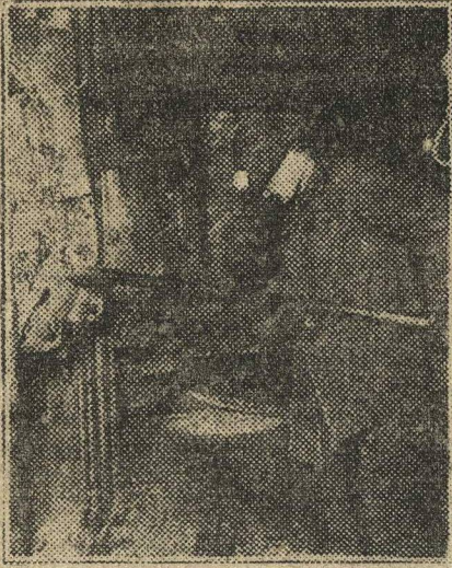
Ударник-ленинец у мартена.

Нужно мобилизовать молодежь вокруг призыва в ударные бригады. К бюро ячеек, которые не способны это-