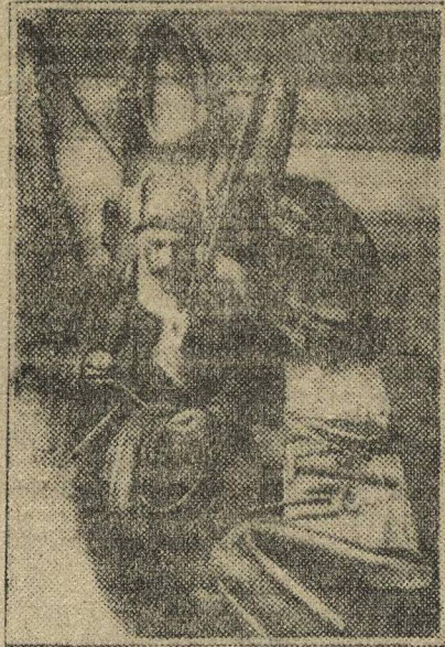
Чинит сбрую. Готовится к севу.

Или вот еще случай. Адышевская ячейка комсомола даже теперь не при-