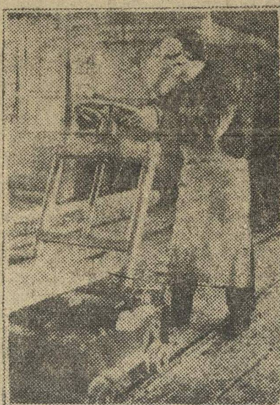
Подвешивают тормозные колодки к трамвайным полускаткам.

В районах весь актив мобилизован на проведение призыва, к каждому предприятию прикреплен от райкома комсомолец.