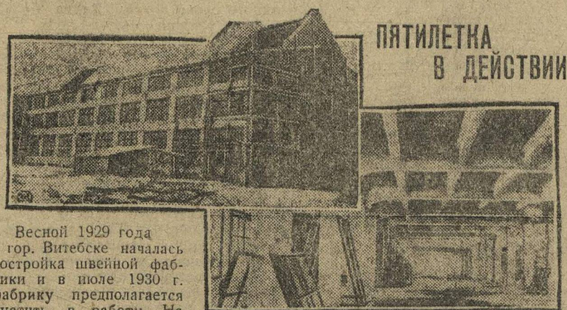
Весной 1929 года в гор. Витебске началась постройка швейной фабрики и в июле 1930 г. фабрику предполагается пустить в работу. На фабрике будет занято 4.000 человек. Работа будет производиться в три смены. НА СНИМКАХ: наружный вид фабрики (сверху) внутренний вид главного корпуса (внизу).