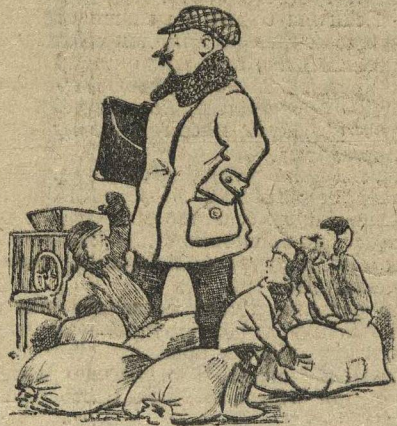
Трудно сказать, кто кому мешает.

Многие смотрят на школьника I ступени и даже учащегося школы повышенного типа, как на ребенка, который способен только воспринимать уроки и заниматься детскими играми. Когда школьники соглашаются помочь в работе населению и хотят взяться за большое дело, то получают отпор от