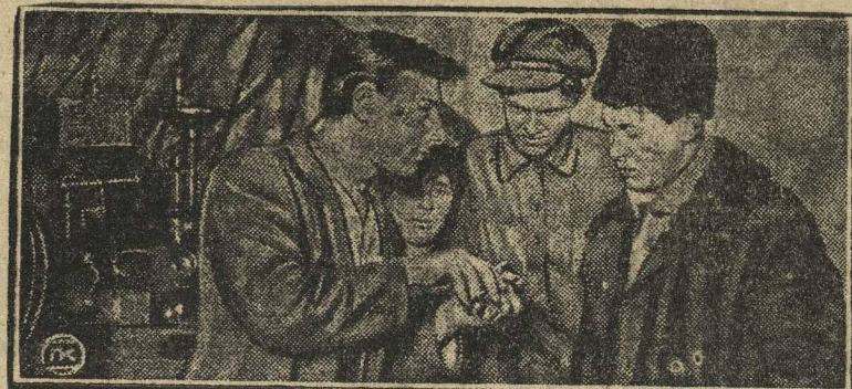
ЗЛАТОУСТОВСКИЙ ГОСУД. МЕХАНИЧ. ЗАВОД. НА СНИМКЕ: Комсомольцы-рабочие цеха машинок для стрижки волос демонстрируют машину тов. Косареву секретарю ЦК комсомола.

Ноябрьский пленум ЦК ВКП(б) постановлением о контрольных цифрах народного хозяйства на 1929—30 г., записал, что в «условиях общей напряженности всего народно-хозяйственного плана, выполнение финансового плана требует величайшей бюджетно-плановой дисциплины, мобилизации всех ресурсов денежных сбережений населения и жесточайшего проведения режима экономии». Эта директива ЦК ВКП(б) должна быть проведена в жизнь. А между тем, сберегательные кассы 2 года подряд не выполнили установленного плана. Объясняется это тем, что вокруг вы-