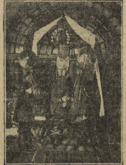
ОЧИЩАЮТ ДОРОГУ КУЛЬТУРЕ. В сельской церкви. НА СНИМКЕ: Колхозники снимают иконы в церкви, которая будет приспособлена для культурных целей.

Эти способы частично уже имеются. Они родились в недрах организаций местных безбожников, рабочих и крестьян. Они сводятся к следующему: ОРГАНИЗОВАТЬ НА МЕСТЕ БЫВШИХ МОНАСТЫРЕЙ — КОММУНЫ БЕЗБОЖНИКОВ, А В ЗДАНИЯХ ВСЕХ ЭТИХ НАИБОЛЕЕ «ЗНАМЕ-