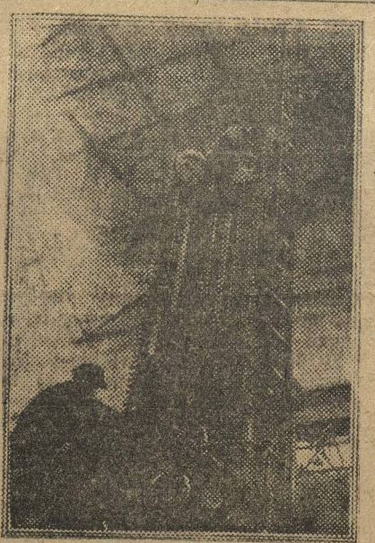
Установка универсальной стойки для фрезерного станка на «Кр. Сормов». Этот станок второй по величине в мире.

шаты, исходя из генеральной линии партии, исходя из задачи еще более беспощадной борьбы со всеми отклонениями от нее, с правой опасностью — как главной опасностью, и с рецидивами «левого» оппортунизма. Ив. Пиндюр.