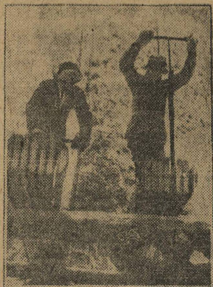
В лесах, вблизи деревни Ягодка, Котельничского округа, идут большие работы по лесозаготовкам. НА СНИМ-КЕ: Обработка леса.

Рубя под корень экспортные березы и ель, мы тем самым подсежем корни пьяной масленицы, лежащие тяжелым гнетом на коллективизирующейся деревне.