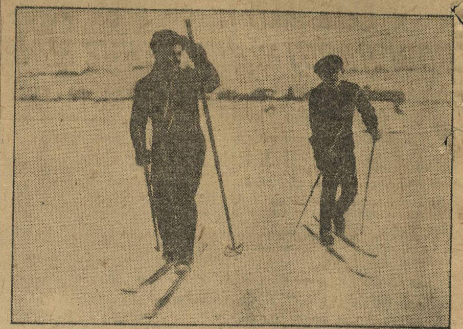
Лыжники в пути.

Между тем, команда, вышедшая из Вотского округа, голодная и никакой поддержки со стороны организации Вотского округа не встречает. Вотский ОблСФХК сообщил телеграф