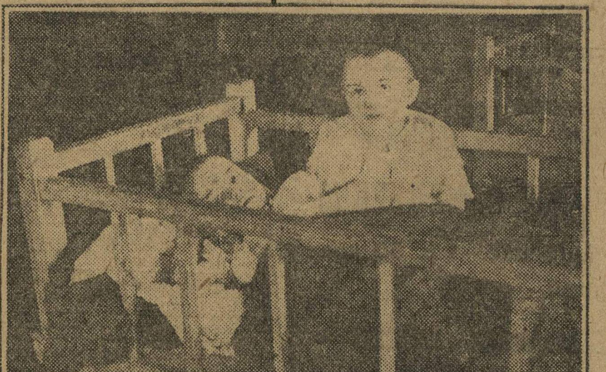
В Первомайской коммуне (Вятский округ) организованы ясли для детей колхозников.