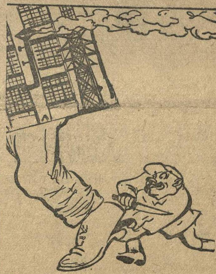
Рвач на ходу подметки режет.

В дизельном цехе из 85 комсомольцев цеха в рационализаторской группе только двое. Внимание рабочих к вопросам рационализации не привлечено. В школе ФЗУ рационализаторское