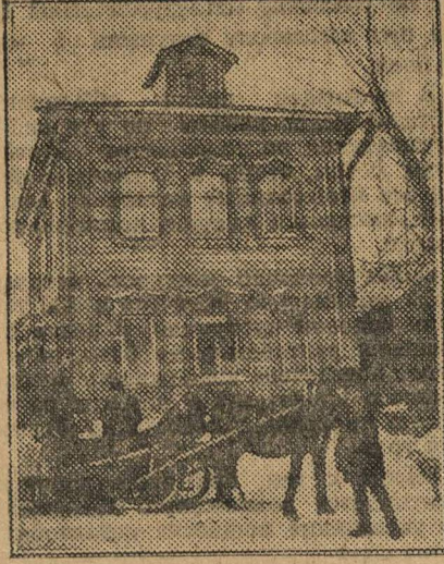
Дом, отобраченный у кулака для нужд колхоза. НА СНИМКЕ: Вывозят отобращенное у кулака имущество.