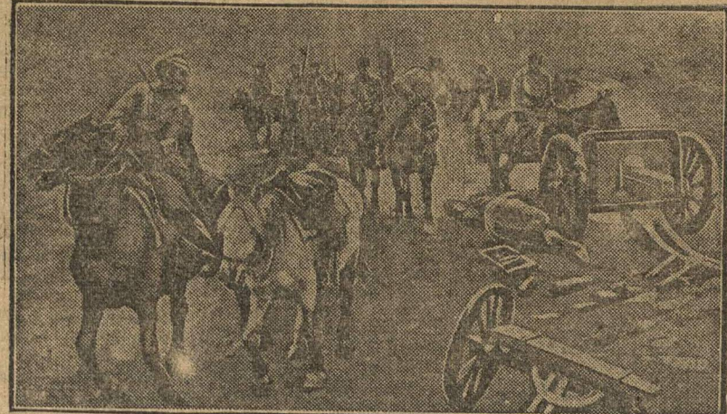
10-ЛЕТИЕ 1-й КОННОЙ АРМИИ. После Октября 1917 г., в Сальских степях на Дону, Кубани и Ставрополе из революционной части казачества в крестьянства организовались красные конные партизанские отряды для борьбы с белогвардейщиной. В районе станицы Полтавская и Великокняжеская в феврале 1918 г. тов. Буденным организуется отряд, который вскоре вырастает в конный полк. На снимке: отряд тов. Буденного в 1918 г. в Сальских степях.

В этот же день приезжает начальник управления военно-морских сил т. Муклевич