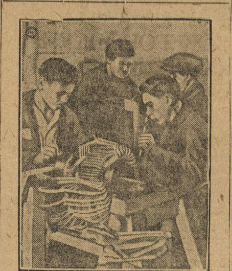
МОЛОДЫЕ УДАРНИКИ. Ученики фаб-завуча после занятий. Ремонтируют в порядке ударной нагрузки динамо-мотор.

Производсовещания еще не используются для выполнения программ. Часто то, что предлагают рабочие, не используется, не применяется в производстве, хотя и представляет большую ценность.