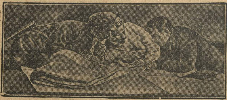
Тов. Буденный, т. Фрунзе и т. Ворошилов на врангельском фронте в 1920 г. за оперативной картой.

Укрепляя нашу промышленность, борясь за перевыполнение промпланов, коллективизируя сельское хозяйство, ликвидируя как класс, кулака, мы наносим смертельные раны капиталистическому миру. Но он еще живуч — капиталистический мир, он хочет стереть с лица земли ненавистную ему республику советов. К этому, к новым попыткам втянуть нас в войну, мы должны быть готовы. Будем же крепить обороноспособность страны, будем учиться владеть оружием.