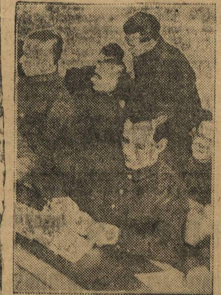
Красноармейцы проходят специальные курсы, чтобы быть организаторами новой деревни.

Митрофановна, не подкачай, ильонь еще малость!