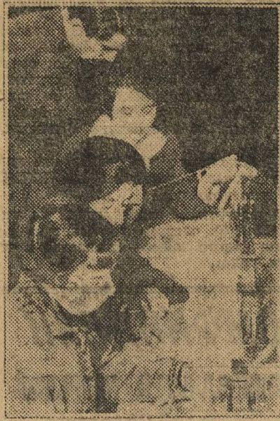
Будущие военные телеграфистки.

В 4-й Нижегородской школе имени «Первого Мая», при ячейке Осоавиахима имеются два военных кружка, в которых ребята занимаются с большим интересом. Сейчас эти кружки из-за отсутствия помощи со стороны Горсовета Осоавиахима близки к развалу. Инструктор руководящий старшей группой уехал на весенне-посевную кампанию. Занятий в кружке не стало. В кружке для учащихся младшей группы было только 4 занятия. Больше инструктор в школу не заявлялся. Председатель ячейки Осоавиахима старается проводить занятия