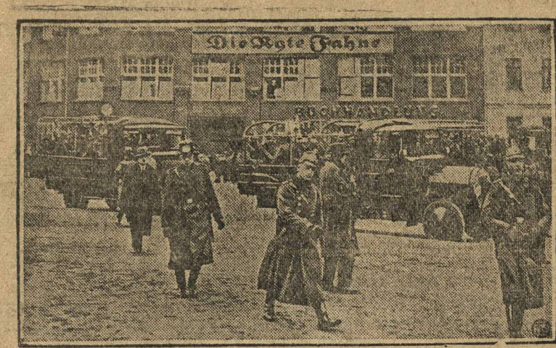
ТЕРРОР ПРОТИВ КОМПАРТИИ ГЕРМАНИИ. На днях берлинская полиция по приказу социал-демократических властей произвела дерзкий налет на помещение ЦК германской компартии. Обыск, продолжавшийся около 4-х часов не дал никаких результатов. На снимке: полицейские грузовики у здания ЦК германской компартии в Берлине.