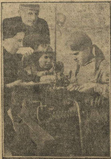
Ученики школы ФЗУ завода «Красное Сормово» собирают паровую машину.