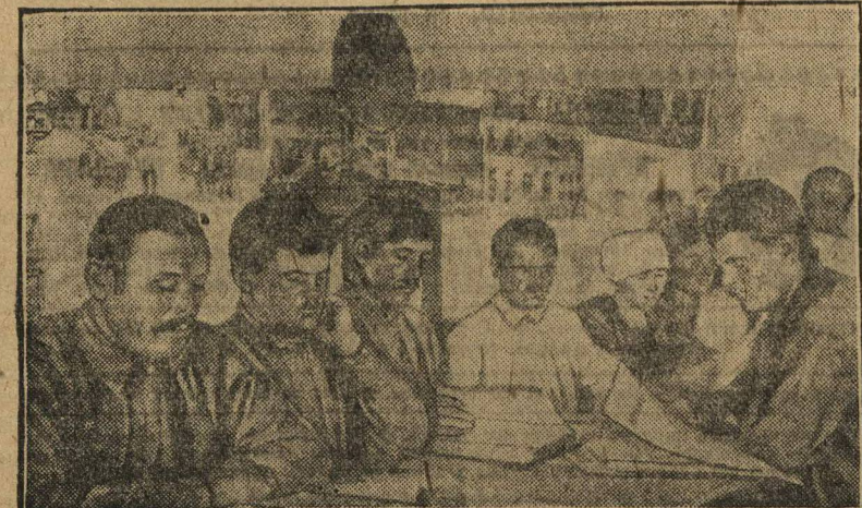
БЫТЬ КОММУНЫ. Красный уголок в сельскохозяйственной коммуне.