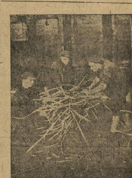
21-го по инициативе комсомольцев прокатного цеха завода «Кр. Этна», состоялся ударный час по уборке цеха. В работе по уборке цеха приняли участие все рабочие цеха. На снимке: момент уборки в цехе.