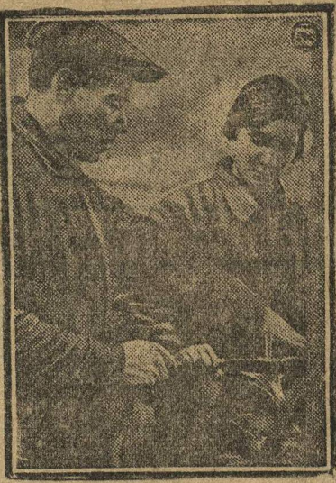
ДАДИМ «7000» КОМСОМОЛЬЦЕВ ТРАКТОРОСТРОЮ. В Сталинград на Тракторострой начали прибывать на работу группы комсомольцев в счет брони «7000» ЦК ВЛКСМ. На снимке: обучение комсомольки, прибывшей в счет «7000» работе на тракторном станке.