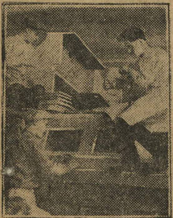
Еще одна комсомольская бригадка-коммуна организована на заводе им. Воробьева. В бригаду-коммуну вступило 7 ч. молодых рабочих столярного цеха. На снимке: бригадники за работой.

ПАРИЖ. По сообщению агентства Гавас, палата 316 голосами против 263 выразила доверие новому правительству Тардье.