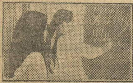
На ликпункте (Вокресенский район, Ниж. окр.).