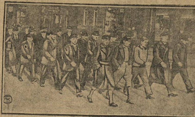
В окрестностях Берлина, перед заводом «Агфа» состоялась демонстрация безработных, призывавших к активному участию в борьбе с капиталом. НА СНИМКЕ: демонстрирующие безработные.

Большинство новых строителей взяты с биржи труда и в прошлом не имели никакой профессии. Из выпущенных 1000 чел., — 40 проц. женщин, которые при выпускных испытаниях доказали, что они могут быть хорошими строителями, зачастую даже лучше мужчин. Значительная часть среди выпущенных строителей—молодежь.