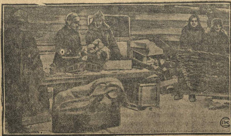
ПИОНЕРЫ — НА ПОМОЩЬ ВЕСЕННЕМУ СЕВУ. На снимке: пионеры колхоза «Серп и Молот», Хоперского округа, на зерноочистке.

Поэтому с 10 марта по 10 апреля, ВЦСПС объявляет по всему Союзу месячник проверки участия физкультурников в ударном движении. С этой целью на места выедут бригады ВЦСПС. Помимо того, будет организована широкая взаимная проверка кружков.