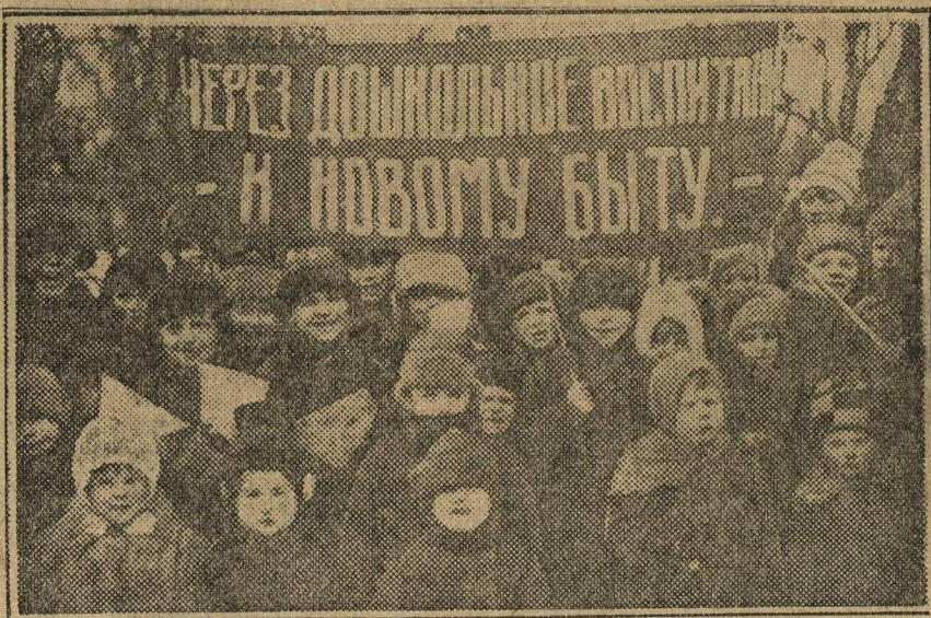
ДОШКОЛЬНЫЙ ПОХОД В Н.-НОВОГОРОДЕ. На снимке — дети-дошкольники на демонстрации.