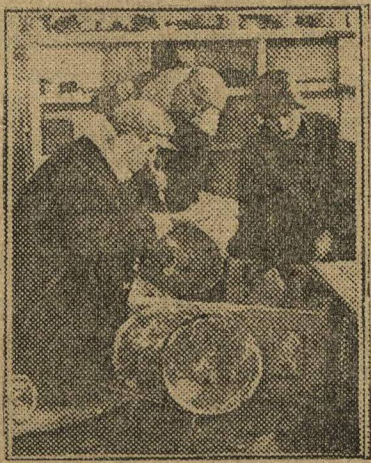
ОБЕСПЕЧИМ ТРАКТОРА ЗАПАСНЫМИ ЧАСТЯМИ. На снимке: распаковка прибывших запасных частей к сел.-хоз. машинам на складе Сельхозснабжения в Самаре.