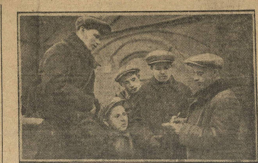
Ударная бригада в помощь директору.

В транспортном отделе бригада обнаружила, что платформы бесположно разгуливают в заводе по месяцу, в то