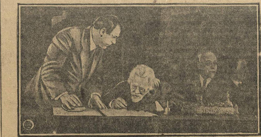
СОЦИАЛИСТИЧЕСКОЕ СОРЕВНОВАНИЕ АКАДЕМИЙ НАУК. В Ленинграде подписан договор социалистического соревнования трех академий: Академии Наук СССР, Украинской и Белорусской Академий. На снимке: президент Академии Наук СССР Карпинский подписывает договор.