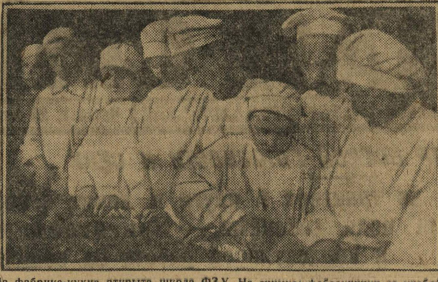
На фабрике-кухне открыта школа ФЗУ. На снимке: фабзаучники за учебой.