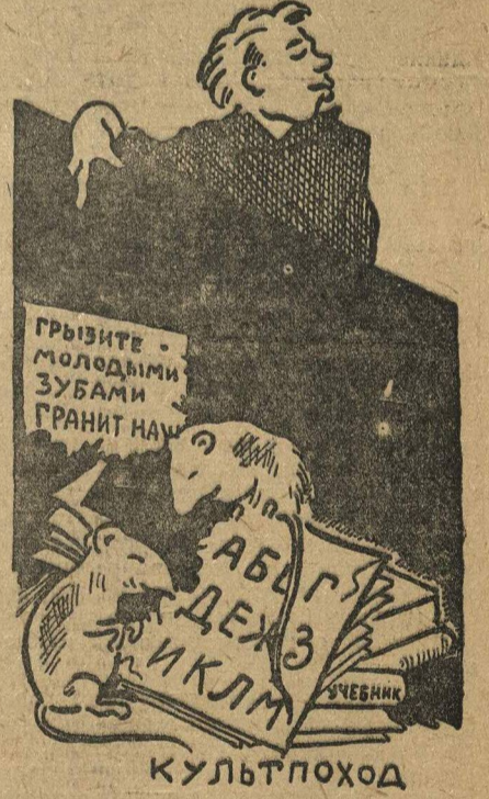
«Культурники у нас во главе УГЛА».