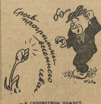
...и головотыпы пожут.