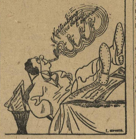
Посади свинью за стол она... и промфинплан под стол.

Она даже не удосужилась вынести на обсуждение партийцев цеховой промфинплан, ограничившись обсуждением на общем собрании резолюции бюро ячейки по докладу администрации.