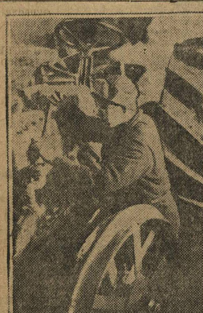
В Нижегородских тракторно-ремонтных мастерских. На снимке: установка блока.

Комсомольцы «Гудка Октября», позорно проспав срыв промплана, комсомольцы являются виновниками недоснабжения с.-х. орудиями колхозов, на которые работает завод. За систематическое невыполнение промплана завод занесен на черную доску.