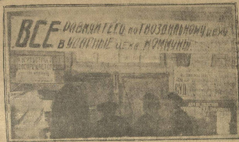
Плакат, вывешенный в цепочном цехе завода «Красная Этна».

Но не все рабочие гвоздильщики были сознательными. Отсталые элементы рабочих были уличены в умышленном увеличении брака, в приписывании се-