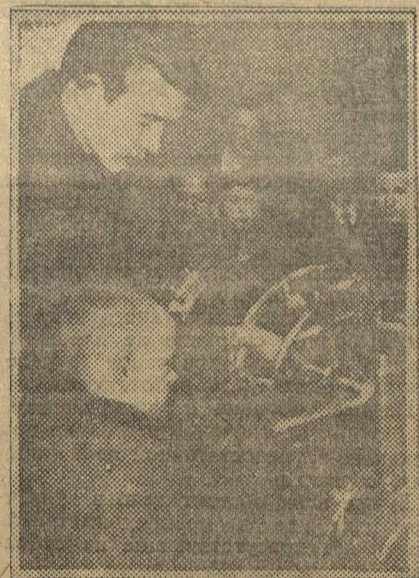
Октябренок достает первый билет из тиражного колеса.

Эти отделения пойдут на индустриализацию страны.