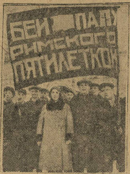
Демонстрация протеста против выступления папы римского в Н.-Новгороде. На снимке—группа демонстрантов.

Но мы то знаем цену этому очковителству. Мы-то знаем, что для империалистов все мирные пути исключены. Им остается только одно—война—и лондонская конференция только ускорила ее.