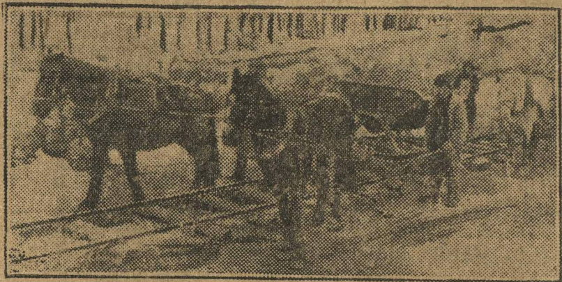
НА АВТОСТРОЕ. На снимке: работы по сооружению эстакады.

Работа кипит. Однако на строительстве есть много неполадок и отставаний. Отмечены случаи рвачества и засоренности чужаками состава рабочих и управленческого аппарата. Ни минуто не ослабляя темпа работ, лучшие силы строительства борются с прорывами и неполадками. Рабочая общественность на ходу очищается от рвачей, лодырей и примазавшихся. На