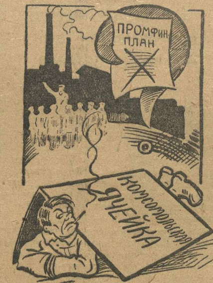
«Наше дело сторона».

Переход на сменные ячейки увеличил не только посещаемость, он повысил активность, он улучшил качество работы. Сейчас по примеру парт-ячейки переход на сменные ячейки обсуждают и комсомольцы сталелитей-цехи. Этот переход требует быстрой проработки не только в сталелитейном цехе, но во всем заводе. Только тогда, когда комсомольской ячейкой будет охвачена вся молодежь, когда ячейки полностью перейдут на метод добровольчества и конкретных заданий, будет готовиться новый актив, который необходимо будет приближать к руководству.