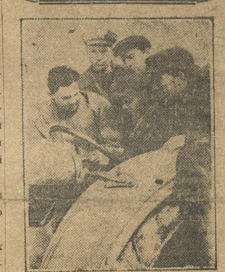
1-го апреля закончила занятия группа трактористов при индустриальном техникуме. Выпущено 38 человек, которые направляются на практику в колхозы Нижкрая. НА СНИМКЕ: трактористы за учебой.

«ОТ УДАРНОЙ БРИГАДЫ К УДАРНОМУ ЦЕХУ, ОТ УДАРНОГО ЦЕХА К УДАРНОМУ ЗАВОДУ — это должно явиться практическим ЛОЗУНГОМ ДЕЙСТВИЯ каждой комсомольской организации»... «Поставить ближайшей задачей комсомольских организаций поголовный охват социалистическим соревнованием и движением ударных бригад всех комсомольцев и всей рабочей молодежи»... (Из решений VI декабрьского пленума ЦК ВЛКСМ)