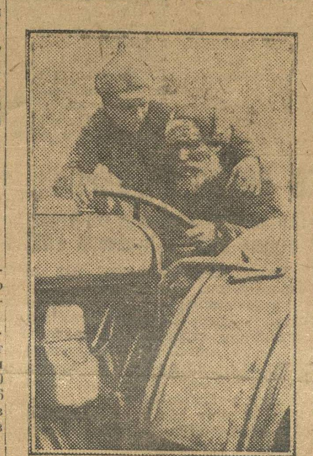
Демобилизованный красноармеец — комсомолец обучает колхозника управлять трактором.

К 1-му апреля надо было закончить сбор семян, сортировку, землестроительство, надо было завезти удобрения, запастись фуражом для рабочего скота и закончить контрактацию посевов. В Б.-Покровском районе, Нижегородского округа сделано далеко не все. Местные работники, увлеченные мол-