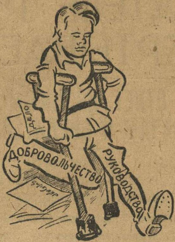
На костылях старой системы. Комсомольский инвалид.

В реконструктивный период, когда вся работа должна быть подчинена задаче выполнения пятилетки в четыре года, все остальное должно нахо-