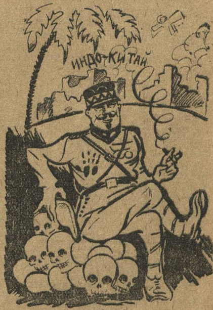
Сладкий отдых после тяжелого труда.