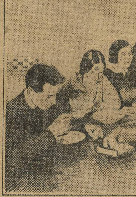
В КОММУНЕ СТУДДОМА ИМ. ЛЯДОВА. Коммунары за обедом.

Перед коммуной стоит задача — культурной использовать и выходной день коммунара. Работа в этой области почти не развернута. Правда, был один выход коммуной в кино и на лекцию Куна. В ближайшее время предполагается заслушать на коммуне сообщения бригадиров, ездивших в деревню по весенней посевной кампании и организации колхозов. Думают посетить коммуной Нижполиграф и авто-сборочный завод. Но пока это проект. Комму-