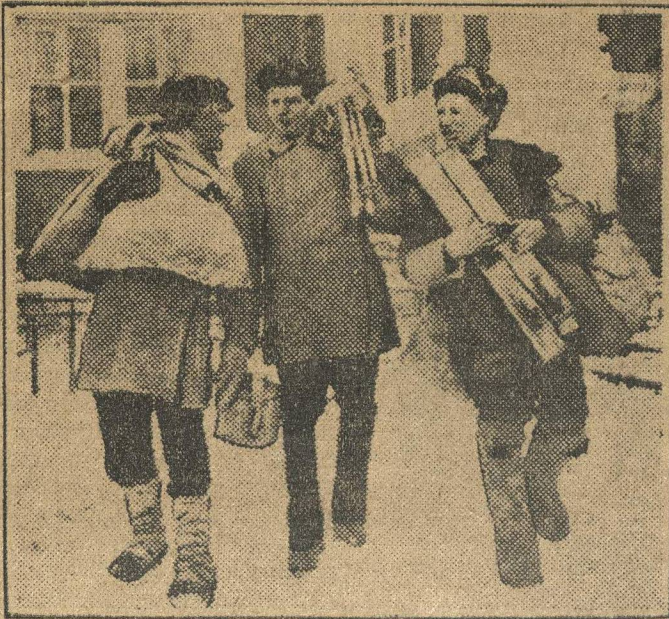
Накануне строительного сезона.—Сезонники прибывают.