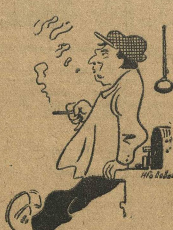
— Зачем доводить до станка! Полно выдумывать!