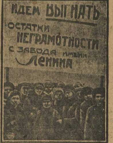
НА СНИМКЕ: демонстрация учащихся воронежских школ за поголовную ликвидацию неграмотности на заводах. Учащиеся ходили в обеденный перерыв по цехам завода им. Ленина и выявляли неграмотных рабочих.