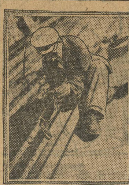
НА СТРОЙКЕ. Автогенная резка балок.

Подобное безобразие происходит с продвижением удобрений и сортовых семян. Шарьинцы своими медлительными темпами обратили на себя внимание центра. На днях ОкрЗУ получило телеграмму от Наркома Земледелия СССР, тов. Яковлева.