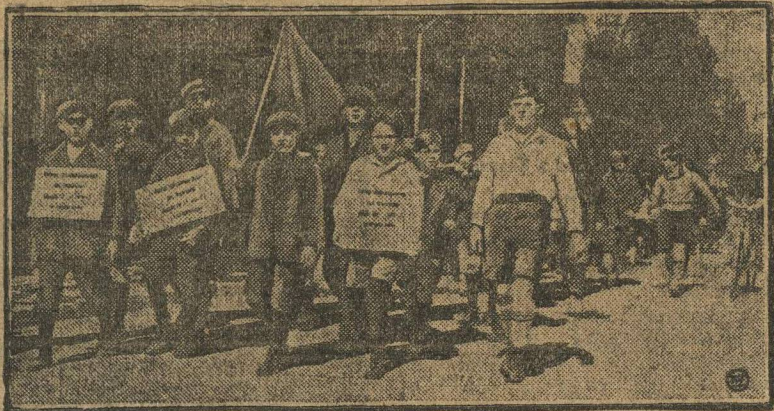
ЗАБАСТОВКА ШКОЛЬНИКОВ В БЕРЛИНЕ. В рабочем квартале Берлина—Нейкельне, с громадным успехом протекает забастовка школьников. Школьники Нейкельна организовали внушительную демонстрацию против отмены бесплатного питания в школах, сокращения экскурсий, сокращения числа учителей и т. п. Власти и полиция принимают меры к тому, чтобы воспрепятствовать переброске этого движения школьников в другие районы. НА СНИМКЕ: Демонстрация школьников.