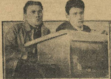
Делегаты партсовета слушают доклад.

разования изжила себя и лечить ее нет никакой надобности, ее надо ликвидировать.