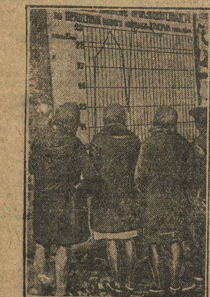
Знакомятся с показателями по выполнению промфинплана.

Павловским райкомом ВСРМ были посланы в деревню бригады по ремонту сел.хоз. машин и по культурной работе.