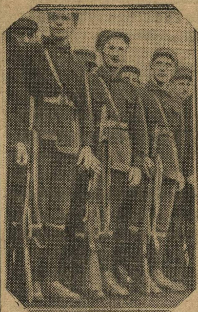
МОЛОДЕЖЬ УЧИТСЯ ВЛАДЕТЬ ВИНТОВОЙ. На снимке — строевые занятия.

При школе организован физкультурный кружок. Выходит стенгазета. Зимой удалось приобрести 20 пар лыж. Ребята сильно увлеклись зимним спортом. Устраивались