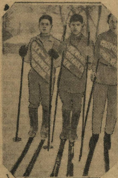
Учащиеся-мопровцы школы «9 Января» (Ниж.-Новгород) устроили лыжный агитпробег. Цель пробега—организация в деревнях ячеек МОПРа.

Общее собрание участников шахматного и шашечного чемпионатов Б. Нижнего коллективно подписывается на 3 месяца на газету «Ленинская Смена» и вызывает подписаться на тот же срок всех участников больших и малых чемпионатов Вятки.