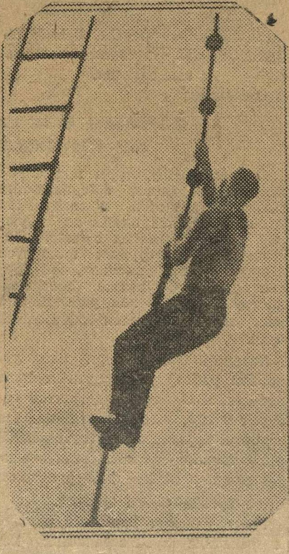
нижегородцы в Москве

3 апреля нижегородские физкультурники из «Динамо» выезжали в Москву для товарищеской встречи с московской «Динамо» по баскет-болу и волей-болу.