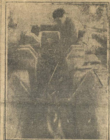
На заводе «Кр. Якорь» установлен германский пресс для испытания цепей. На снимке: заправка цепи.

...Сухие отношения Крайсовпрофа, отпечатанные на тонкой папиросной бумаге и разосланные по крайотделам