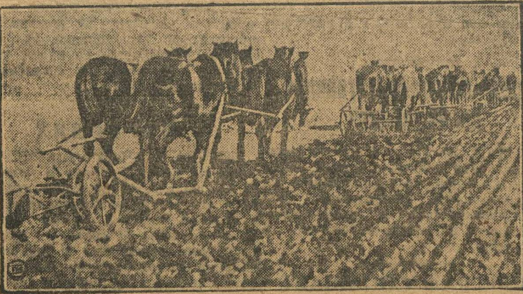
Первый выезд на колхозные поля.

Сортовыми семенами и сельскохозяйственными машинами и орудиями колхоз обеспечен. Колхоз расширяет посевную площадь на 15 проц. из городского земельного фонда. Могли бы посевную площадь увеличить и еще, но не хватает тягловой силы.