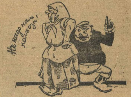
Кто о чем, а кулак все о том же.

По Виловато-Вражскому району, Козмодемьянского кантона, Марийской области, работа по сортированию