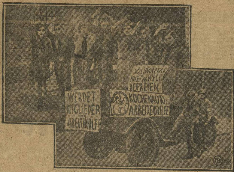
ПИОНЕРЫ-УДАРНИКИ В АВСТРИИ. В Австрии Межрабпом организованы группы пионеров-ударников, которые развивают большую пропагандистскую и вербовочную работу в пользу МОПРа. На снимке: сверху — группа австрийских пионер-ударников, внизу — агит-автомобиль МОПРа.