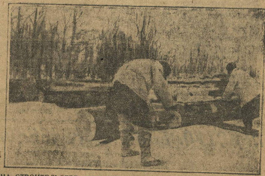
НА СТРОИТЕЛЬСТВЕ АВТОЗАВОДА. Обработка бревен для строительства.