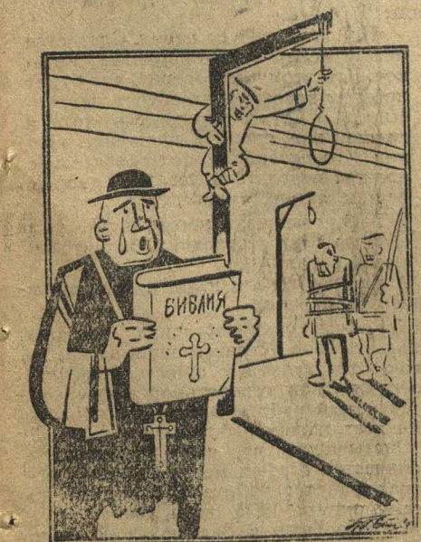
МИССИОНЕР: — Господи, спаси этого русского от большевиков.

Американские миссионеры (попы) с разрешения американского и германского консулов, а также китайских властей, взяли с собой Библию, русские Библии на русском языке.