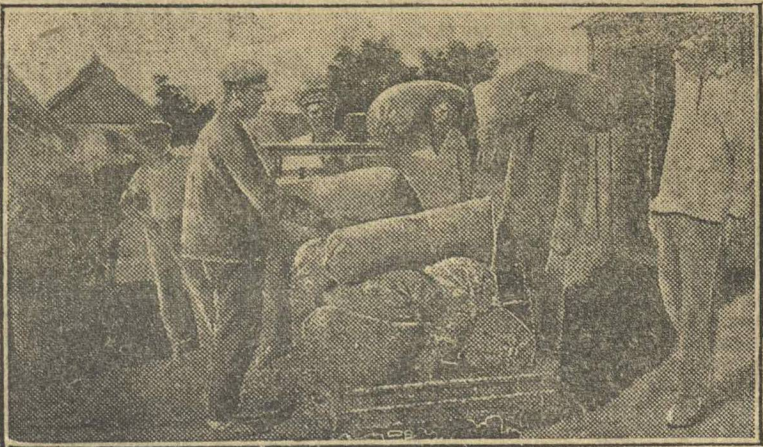
ХЛЕБОЗАГОТОВКИ НА УКРАИНЕ. Члены т-ва по совместной обра- ботке земли «Днепрострой» в с. Николаевка, Новомосковск. района, сдают свои хлебные излишки на заготовительном пункте.

— Ах, ты, сволочь проклятая, а как ты у меня кровь сосал — забыл?