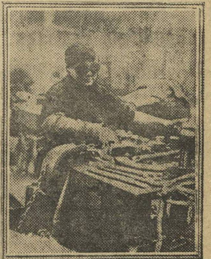
Ударница за автогенной сваркой цепей (завод «Кр. Этна»).