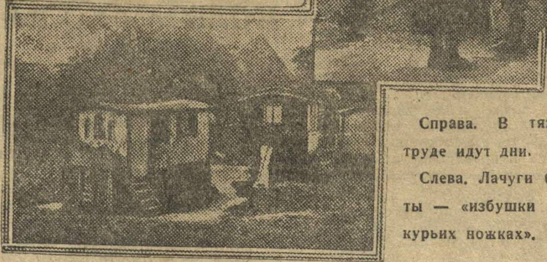
Справа. В тяжелом труде идут дни.

Почва на этих горах каменистая и людям долго и тяжело приходится работать, чтобы добыть скудный урожай хлеба или картофеля. Лето здесь коротко и его быстро сменяет суровая зима. А если выпадет дождливое лето, тогда весь тяжелый труд пропа-