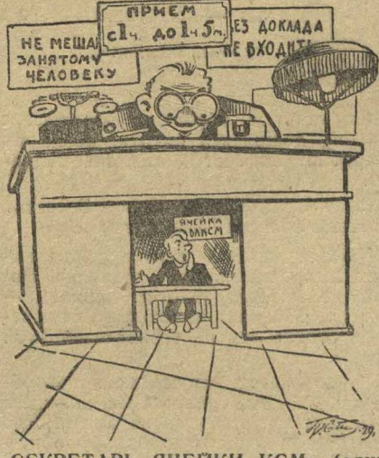
СЕКРЕТАРЬ ЯЧЕЙКИ КСМ (один из многих). — Да, у нас и бюрократов нет. Кого же чистить?

Кроме этого, производственные ячейки КСМ должны заняться привлечением рабочих на собрания по чистке собиранием и проверкой конкретных