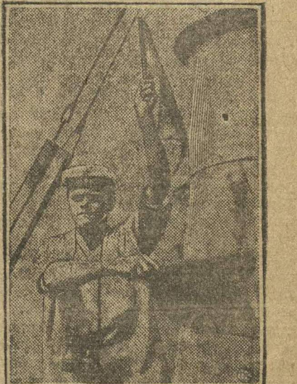
МАНЕВРЫ ЧЕРНОМОРСКОГО ФЛОТА. Сигнальщик с флагами на линкоре.

Беседу прервал вошедший в класс преподаватель. Все расселись по местам. Дальневосточник так же аккуратно, как и все, раскрыл тетрадь... П. Ф. в.