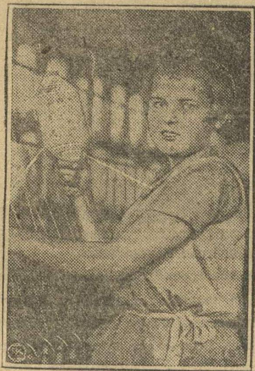
Молодая ткачиха, окончившая ФЗУ, на производстве.

В колдоговорную кампанию необходимо заострить внимание широких