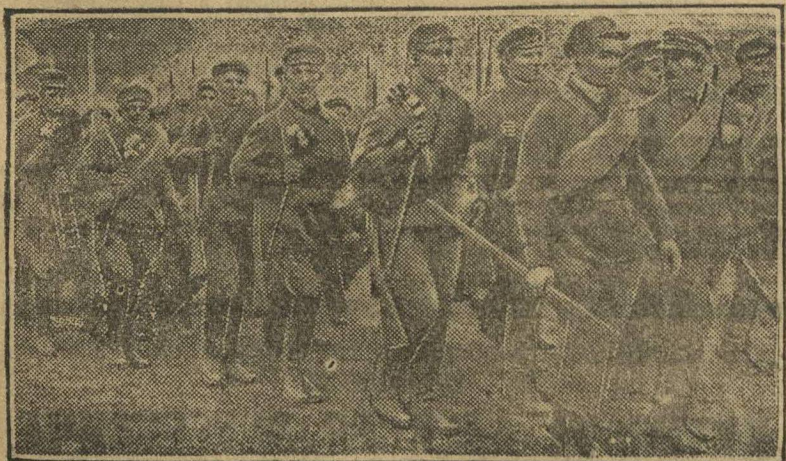
РАБОЧАЯ МОЛОДЕЖЬ НА МАНЕВРАХ. В местных маневрах под Харьковом вместе с частями Красной армии участвовали Осоавиахимовские отряды рабочей молодежи.

Рабочие радостно приветствовали молодую смену. Лапин.