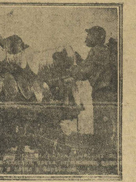
ГОТОВУЮ ПРОДУКЦИЮ ПОТРЕБИТЕЛЮ. С «Красного Цинковальщика» увозят готовые ведра

Автострой договорился 11 окт. с заводоуправлением «Красное Сормово» о производстве деревянных кузовов для грузовиков, которые будут выпускать временная сборочная на «Гудке Октября» и Московская сб-