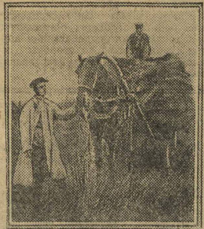
Свозят лен с коллективной полосы

За семенами обратились в кредитное товарищество. Без лишних разговоров комсомольцам дали овса и льна и тут же был заключен договор с ячейкой на контрактиацию. Полностью весь урожай комсомольцы обязались сдать кредитному товариществу.