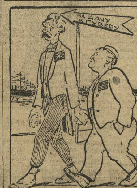
МИРОВЫЕ КОМИКИ Пат и Паташон (они же Макдональд и Гувер) в новой комедии «разоружение на море»

ЦК БЕЛОРУССКОГО КОМСОМОЛА ПРОВОДИТ СУББОТНИК В ФОНД ПЕРВОЙ БЕЛОРУССКОЙ ТРАКТОРНОЙ КОЛОННЫ. Президиум Центрального совета профсоюзов Белоруссии также постановил организовать рабочий субботник в пользу тракторной колонны. Десятки колхозов вступили между собой в социалистическое соревнование.