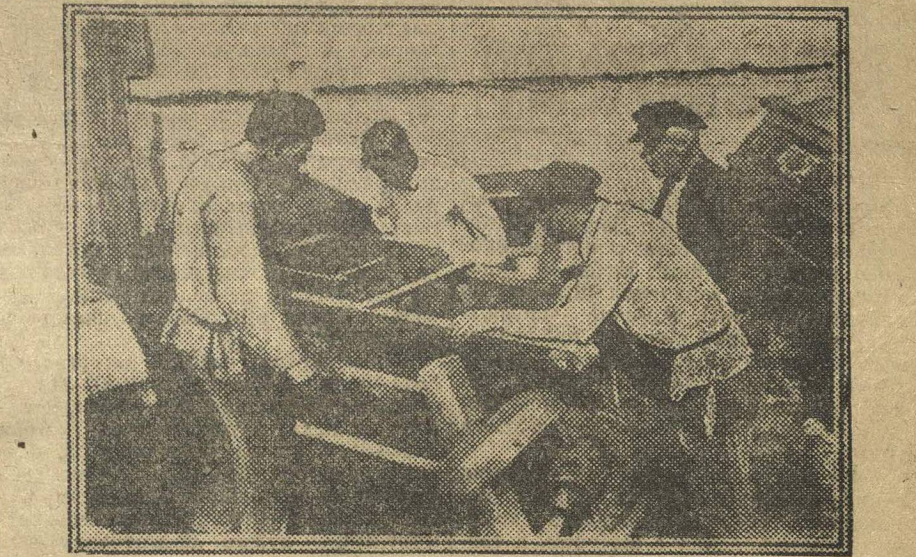
Купили молотилку для колхоза (Лысковский район, Нижегородск. округа).

земле можно безбедно жить не занимаясь торговлей.