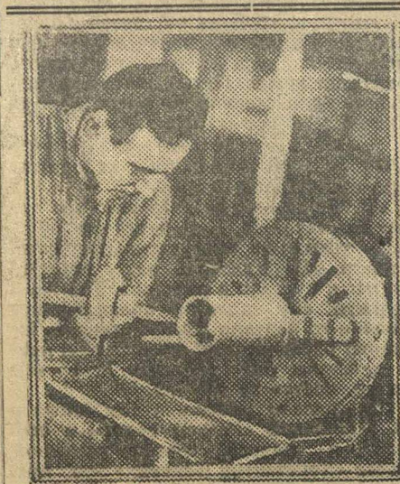
У токарного станка.