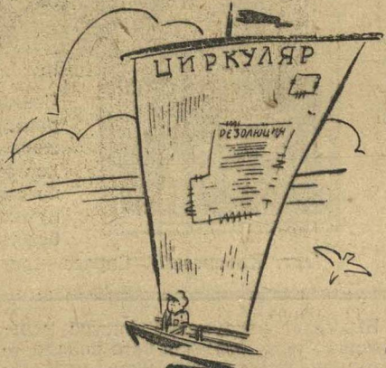
Белеет парус одинокий