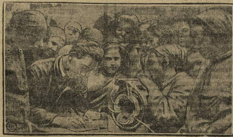
НА СНИМКЕ: Запись молодежи в ударные бригады.