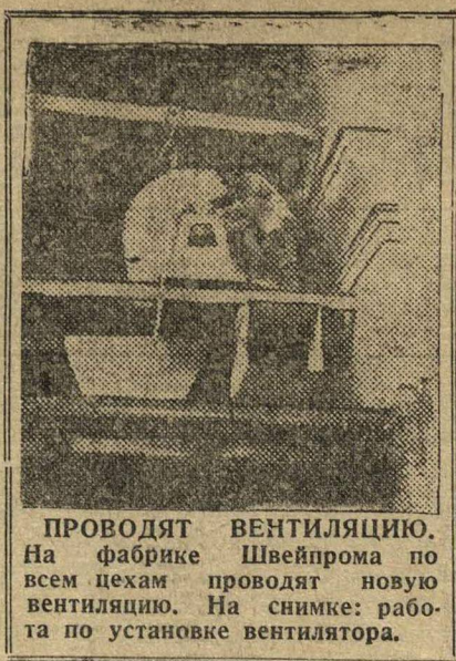
ПРОВОДЯТ ВЕНТИЛЯЦИЮ. На фабрике Швейпрома по всем цехам проводят новую вентиляцию. На снимке: работа по установке вентилятора.

Позавчера Крайисполком отправил в НКПС ходатайство об отпуске 300.000 руб. на проектировку работ по постройке моста через Волгу.