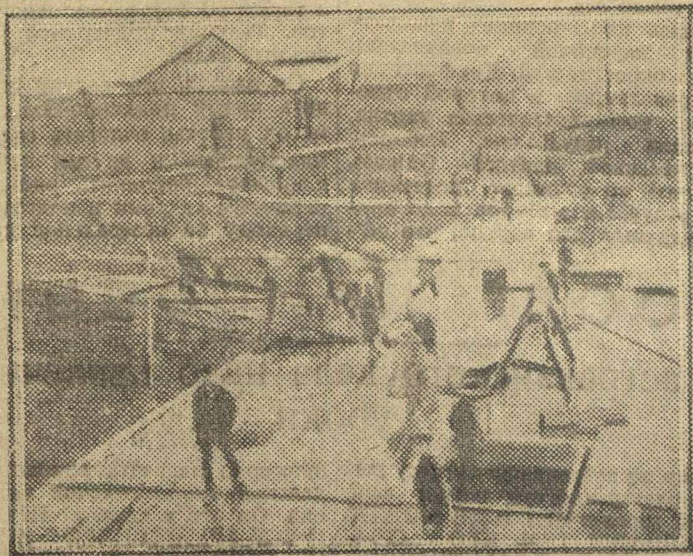
На субботнике. Разгрузка баржи.

Субботник 8-го ноября даст громадную пользу для оборота вагонов по желдороме. Но, чтобы осуществить субботник, нужно организациям, которые не берут грузы, поторопиться с транспортом и свои грузы забрать—так сказала администрация Ромодановского вокзала.