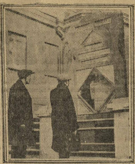
У госбанка в Чебоксарах выставлена витрина, агитирующая за подписку на III заем индустриализации.

Все это снова и снова подчеркивает необходимость и громадную важность разъяснения смысла и значения постановления ЦК об единоначалии.