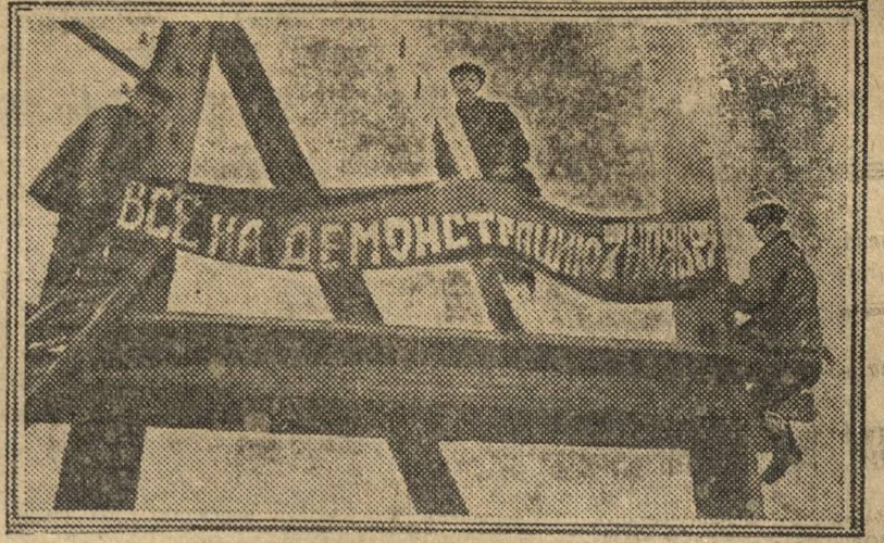
Комсомольцы Сормовской судовой фабрики вывешивают плакат к Октябрьским торжествам.

8-го НОЯБРЯ МАССОВОЕ ФИЗИКУЛЬТУРНОЕ ВЫСТУПЛЕНИЕ И СОРЕВНОВАНИЕ. (Бег вокруг города). Катание детей на автомобилях. В кино-театрах сеансы со скидкой на 50 процентов. Билеты на них распределяются по союзам.