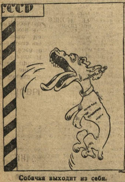
Собачка выходит из себя.

Но враг орудует вокруг нас; каждый из нас должен быть бдителен.