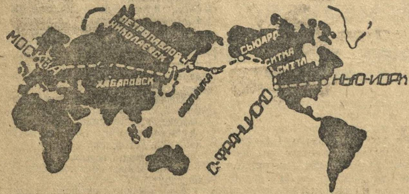
Путь «Страны Советов».

Удачное выполнение нашими славными летчиками советской авиации перелета самым красноречивым образом подтвердило громадное достиже-