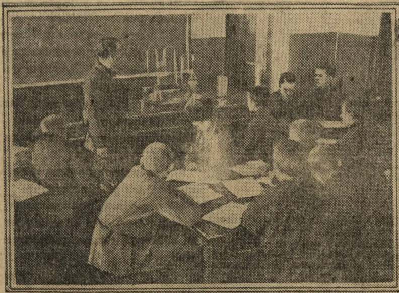
На уроке химии.