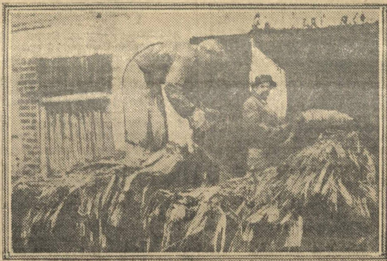
Чувашпайторг производит заготовку мочала для выделки кулей. На снимке: Складывают мочало.