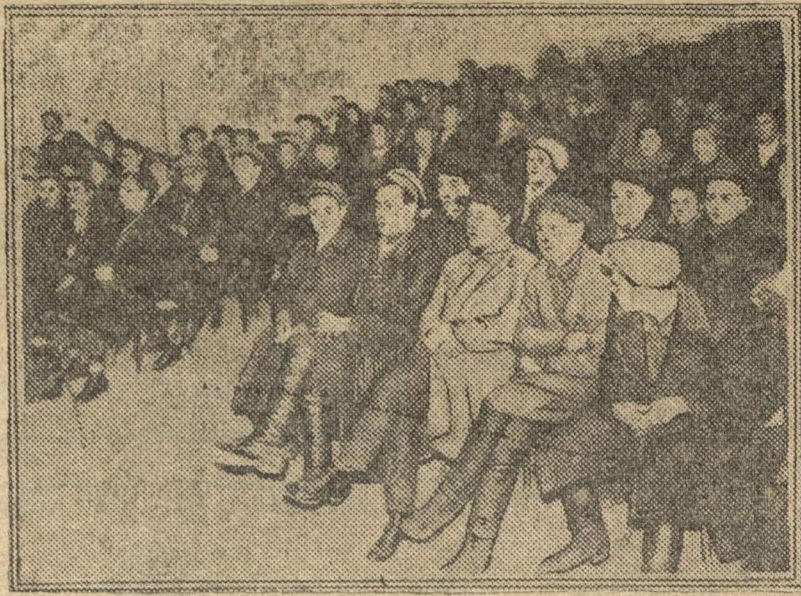
На конференции в Госуваштатеатре.

В принятой резолюции читательская конференция гор. Чебоксар отмечает, что «Ленинская Смена» за время своего существования показала свою политическую выдержанность. Она своевременно мобилизовала и мобилизует комсомольскую массу и трудящуюся молодежь вокруг политических задач партии и комсомола. Конференция от-