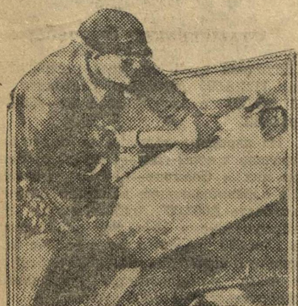
Очистка болванки от раковин пневматическим зубилом. Прокатный цех Кр. Сормова.

периодических отчетов перед всеми рабочими цеха и наглядным цифровым выражением качества их работы на специальных досках соревнования в цехе.