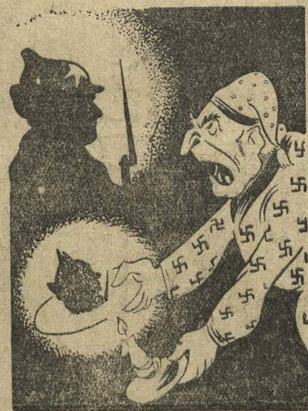
ПОД НОВЫЙ ГОД. Что за черт, который раз гадаю и все одно и тоже мерещится.

Митинг единогласно принял резолюцию, подтверждающую решимость трудящихся масс Франции и угнетенных колоний к совместной борьбе против угнетателей.