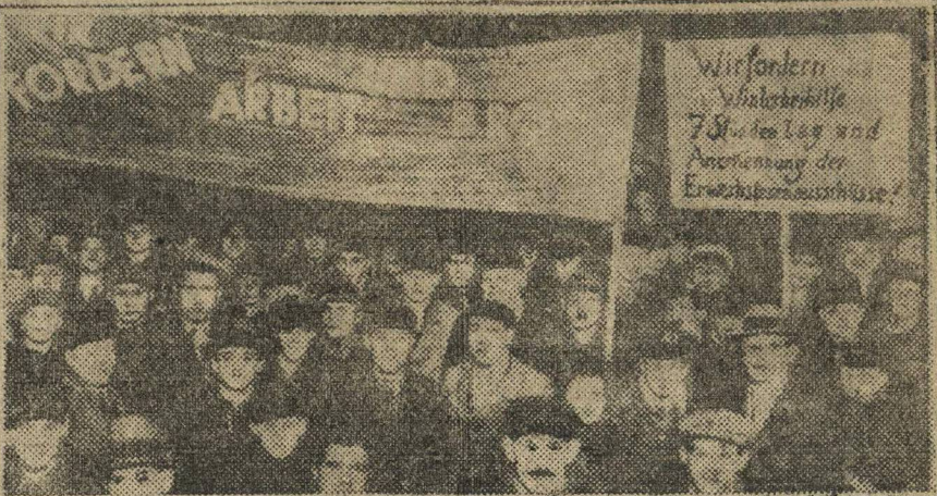
ДЕМОНСТРАЦИЯ БЕЗРАБОТНЫХ В БЕРЛИНЕ. 19/ХІІ в Берлине произошла грандиозная демонстрация безработных, прошедшая с большим подъемом. Улицы, которыми двигались демонстранты, были наводнены полицией. Каждые 100 метров шествие прерывалось полицейскими автомобилями. Во многих местах на безработных полиция напала с резиновыми дубинками. На Александр-плац было произведено много выстрелов. Несколько рабочих тяжело ранено. Произведено много арестов. Безработные решили продолжать свою борьбу на улице. На снимке: Демонстранты с плакатами: На первом надписью: «Мы требуем работы и хлеба». На втором: «Мы требуем зимнее пособие, 7-часовой рабочий день и признания комитетов безработных».

БЕРЛИН, 30. Как сообщает «Роте Фане» наступление буржуазии на германский рабочий класс началось также и в области сел. хоз. В провинции Бранденбург «крестьянский союз» (союз кулаков—сельских хозяев) объявил о расторжении существующих договоров и потребовал значительного снижения зарплаты сельхозработчим.