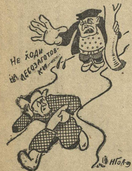
На лесозаготовительной дороге.

Кулаки и антисоветские элементы деревни ведут агитацию против лесозаготовок.