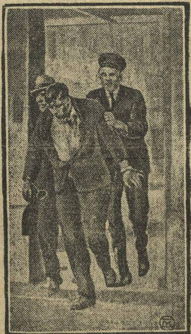
На снимке: После подавления восстания, ведут одного из восставших.

Из заключенных 9 человек убитых и 9 человек тяжело раненых. Из тюремной охраны 1 убит. Бунт в тюрьме и его жестокое подавление являются яркой иллюстрацией жестокости капиталистической Америки, прикрывающей личиной гуманности.