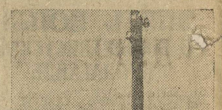
Крестьянин устанавливает антенну на крыше своего дома.

Вот почему весеннему севу партия придает особое значение. Мы должны сказать, что весной нам предстоит второй, еще более грандиозный