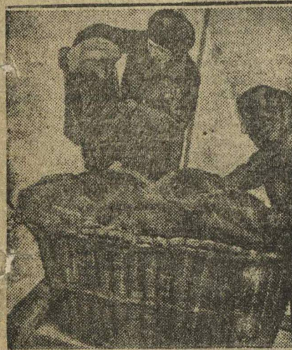
ЗОЛОТО ПОД НОГАМИ. Сбор утильсырья. В Москве начались месячник по сбору утильсырья; собранный утиль поступает на склады для сортировки и затем отправляется за границу. На снимке: Сбор утильсырья.

МОСКВА, 3. Центральный Совет Особых дел обратился с воззванием, в котором призывает всех трудящихся Советского Союза и всех членов Особых дел открыть широкий сбор средств на приобретение для раненых и больных бойцов ОДВА именных коф в красных санаториях и курортах Советского Союза. Центральный Совет ассигновал 50 тыс. руб. на лечение раненых бойцов ОДВА.