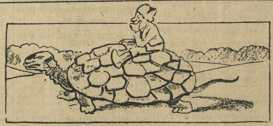
Темпы, которых не должно быть.

Во-вторых, огромная работа, переделанная под руководством партии. Она