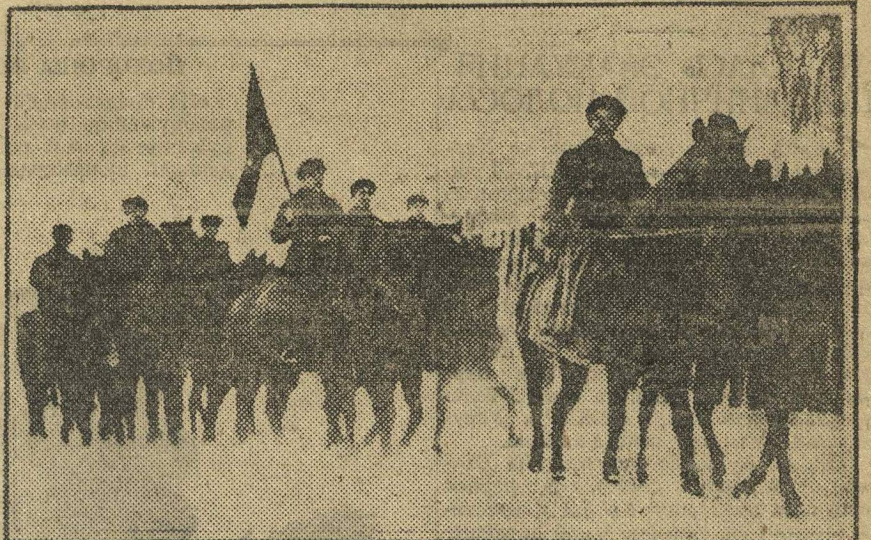
Кавалеристы эскадрона имени «Ленинской Смены» на своем занятии (см. корреспонденцию «Эскадронцы, ребята лихие»).

...Накануне праздника Октября организовали новый субботник. 50 человек