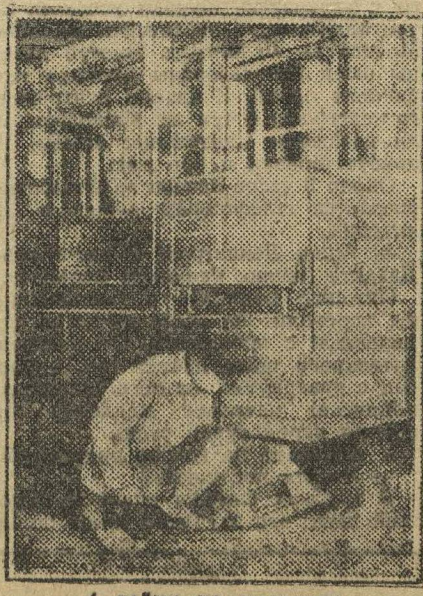
4 веки на мельнице.