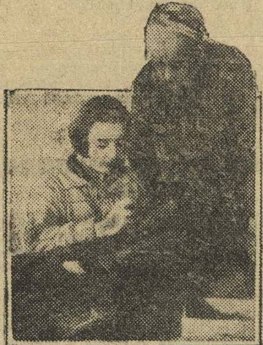
В школе ФЗУ Швейпрома. Учится владеть иглой.

Комсомольский технический поход в Красном Сормове превращается в массовый рабочий поход за технической выучкой. Ячейки и кружки «Техмасс» — инициатива молодежи, название комсомола. Опыт развертывания технического похода сормовичей можно использовать всеми организац. Они сумели хорошо организовать силы, хорошо их использовать. Они не превратили техпоход в узко-молодежное начинание. За молодежью пошли