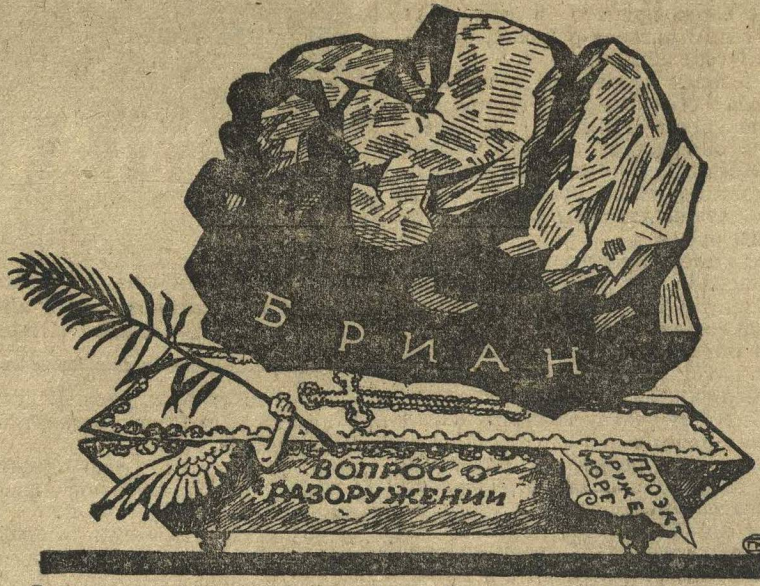
«Лежит на нем камень тяжелый, чтоб встать он из гроба не мог».