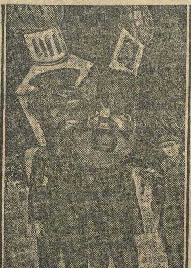
«ПАНИХИДА» ПО РОЖДЕСТВУ. КОМСОМОЛЬСКИЙ АНТИРЕЛИГИОЗНЫЙ КАРНАВАЛ. 6 января в Москве на катке союза совторгслужащих состоялся антирождественский карнавал, который принял характер многолюдного эффектного зрелища. НА СНИМКЕ: Карнавальные маски на льду: поп и кулак.

По поручению экономкомиссии ячейка добилась достижений по рационализации аппарата. Скоро будет организован новый комсомольский отдел.