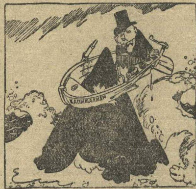
На вершине «стабилизации».

стали боеспособнее, их авторитет в массах вырос. ОСВОБОЖДАЯСЬ ОТ ВЛИЯНИЯ СОЦИАЛ-ФАШИСТОВ, РАБОЧИЕ ИДУТ ПОД ЗНАМЕНА КОМПАРТИИ. Организованными рядами идут пролетарии на штурм крепостей капитала.