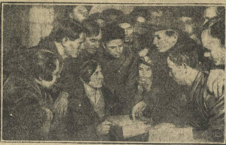
Перед началом занятий политкружком.

Из 20 кружков скомплектованных в городе работают 13. Эти 13 кружков объединяют 302 чел., слушателей, в том числе 151 беспартийного.