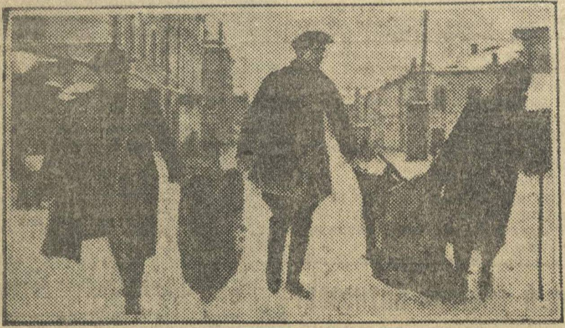
Мелочь свозили на пункты в мешках.

на Театральной площади, при школе 1 Мая, при школе Белинского.