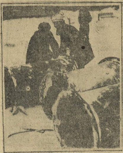
Совсем хорошие трубы — ценная находка.

Молодежь с большим желанием участвовала в воскреснике. Одно плохо, что Госторг не сумел как следует под-