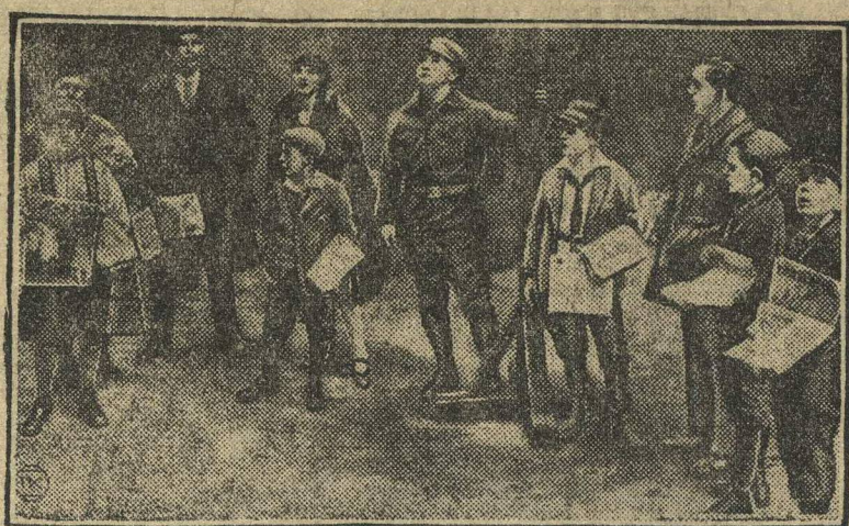
АКТИВНОСТЬ БЕРЛИНСКИХ КОМСОМОЛЬЦЕВ И ПИОНЕРОВ. НА СНИМКЕ: Комсомольцы и пионеры ведут на дворах рабочих районов Берлина пропаганду за партийную прессу.

ВЕНА. Из Софии (Болгария) сообщают, что на собрании евангелической церкви духовенство выступило с травлей Советского Союза. На собрании проникли в большом количестве комсомольцы и члены рабочей партии. Когда выступил с речью священник и позволил себе выпады против СССР, рабочие прервали его возгласами: «Неправда, ложь», стащили его с кафедры и выбросили его из церкви.