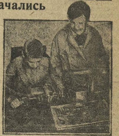
Психотехнические испытания при наборе в Сормовскую школу ФЗУ.

Все поступающие в школу ФЗУ прошли медицинский осмотр. Приемные испытания заканчиваются. Занятия еще не начались.